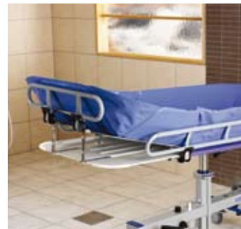
Respaldo ajustable con tres posiciones