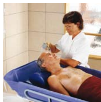
La Concerto ofrece una ergonómica plataforma ideal para realizar tareas de higiene tales como el lavado de cabello.

La Concerto forma parte de la gama completa de sistemas de ducha ARJO. Con la Concerto , la Carendo y la Carino , ARJO ofrece a los centros de cuidado medios de ducha óptimos para residentes y pacientes a todo nivel de movilidad.