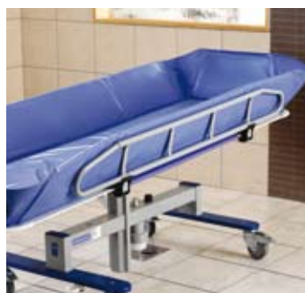
Soportes laterales extra altos