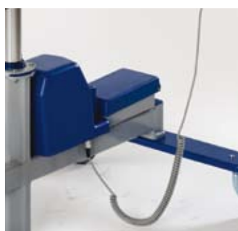
Modelo eléctrico accionado por baterías