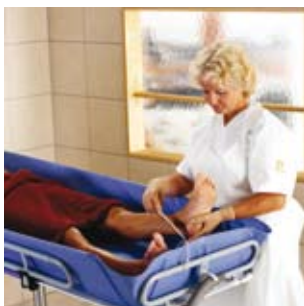
Las tareas de pedicura normales pueden ser realizadas de modo fácil y eficaz.

La Concerto mejora la calidad de vida de aquellos residentes mayores dependientes de cuidado, debido a que hace que las tareas de ducha sean más seguras, cómodas y dignificadas.