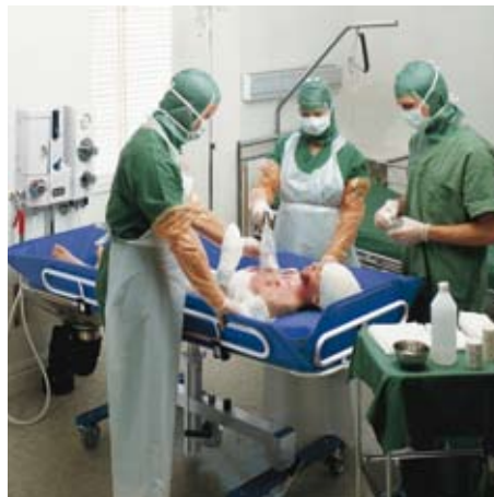
El blando colchón ofrece al paciente la mayor comodidad posible durante los procedimientos de higiene previos a la operación.

En los cuidados intensivos un sistema móvil puede ser especialmente beneficioso. La Concerto puede moverse rápidamente hasta dondequiera que sea requerida en el centro. Nuestra camilla de ducha también puede utilizarse como mesa para cuidados de enfermería y se ofrece disponible en tres largos diferentes, lo cual la hace adecuada en cuidados intensivos tanto para adultos como niños.