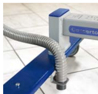
Soporte tubo de desagüe