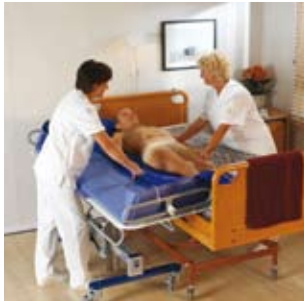
Las sábanas de deslizamiento Maxi Slide permiten realizar transferencias laterales de manera segura y ergonómica.