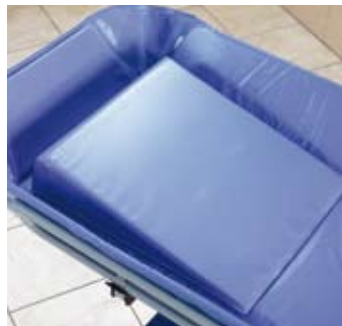
Cojín en cuña

El soporte para la botella de goteo es sumamente útil en entornos de cuidados intensivos.