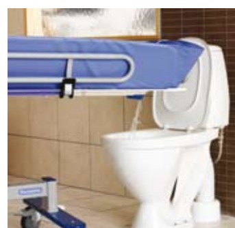
Drenaje flexible, a WC o a suelo.