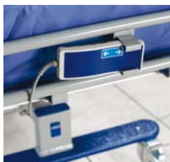
Soporte para el mando de control (solo el modelo eléctrico)