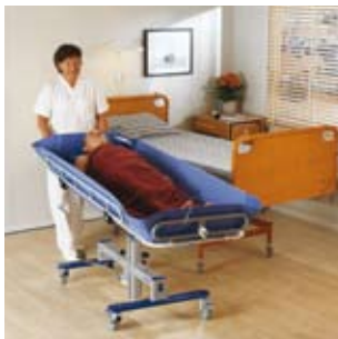
Transporte uniforme con un sistema unidireccional para los pasillos.