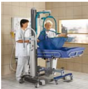
Transferencia fácil y segura hasta la Concerto mediante una grúa de sling.